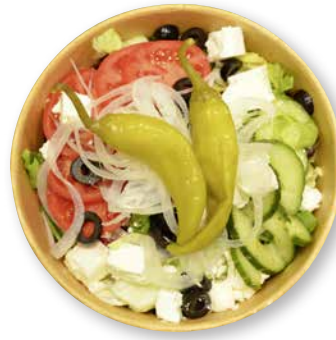
Salatbowl "Griechische Art" Blattsalate mit Tomate, Gurken, Oliven, Feta und Pepperoni