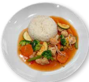
Süß-Sauer Gemüse knackiges Gemüse in süß-saurer Sauce mit Duftreis, Portion

Montag bis Samstag von 11.00 bis 18.30 Uhr Sinzheim von 11.00 bis 20.00 Uhr