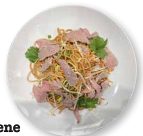
Gebratene Nudeln mit Rind- fleischstreifen, knackigem Gemüse, Sojasprossen und Ei, Portion