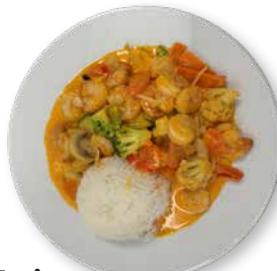
Gelbes Thai Curry (mild) mit Garnelen, knackigem Gemüse und Duftreis, Portion