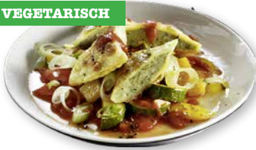
Gemüse- maultaschen auf Ratatouille