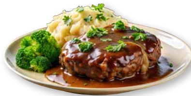
Rinderhacksteak mit Pilzrahmsauce, Spätzle und Gemüse- allerlei mit Edamame