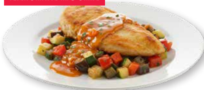
Hähnchen- schnitzel mit Tomatensugo, Nudeln und Zuchinigemüse