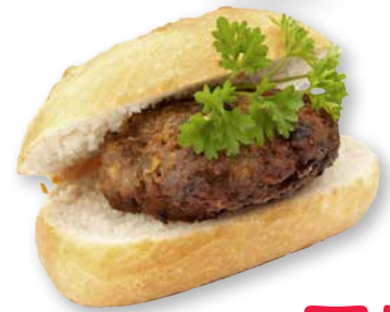
Fleisch- pflanzler- brötchen