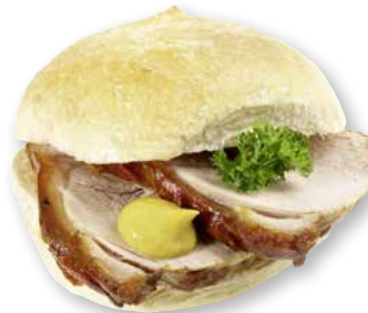
Schweine- krusten- bratenbrötchen