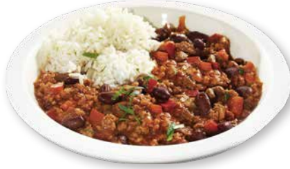
Chili con Carne mit Reis